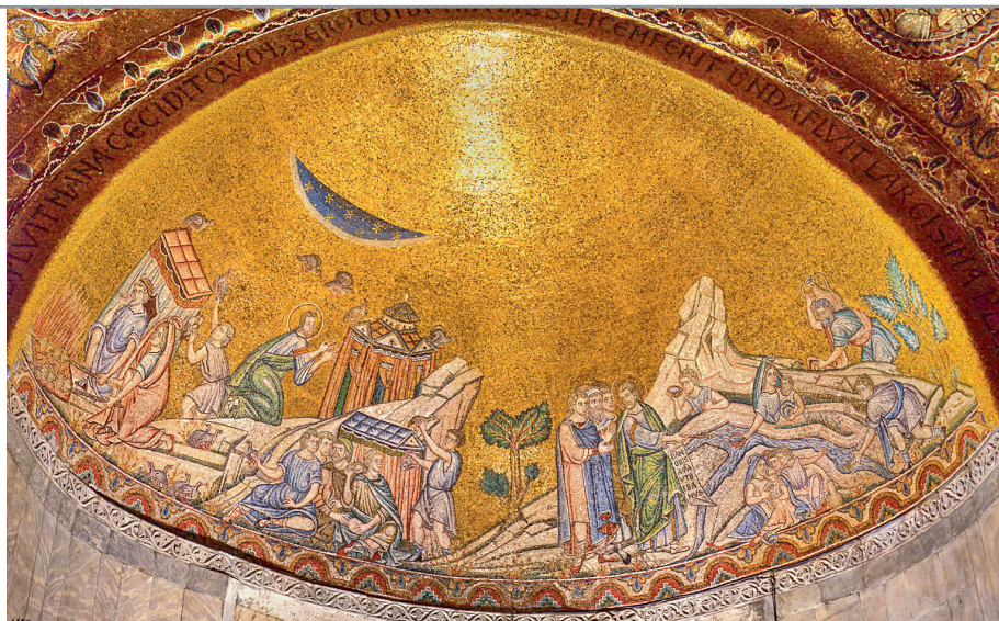
Чудо о перепелках. Схождение манны небесной. Мозаика базилики Сан-Марко в Венеции. XII в.

лежала роса около стана; роса поднялась, и вот, на поверхности пустыни нечто мелкое, круповидное, мелкое, как иней на земле. И увидели сыны Израилевы и говорили друг другу: что это? Ибо не знали, что это. И Моисей сказал им: это хлеб, который Господь дал вам в пищу». Каждому полагалось по гомору на человека 1 , при этом не разрешалось оставлять запас на следующий день. В канун субботы выпадала двойная норма, чтобы на следующий день народ мог соблюдать заповедь субботнего покоя. «И нареком Израилев хлебу тому имя: манна 2 ; она была, как кориандровое семя, белая, вкусом же как лепешка с медом». Сыны Израилевы питались манной сорок лет, пока не пришли в Землю обетованную (Исх. 16:1–35).