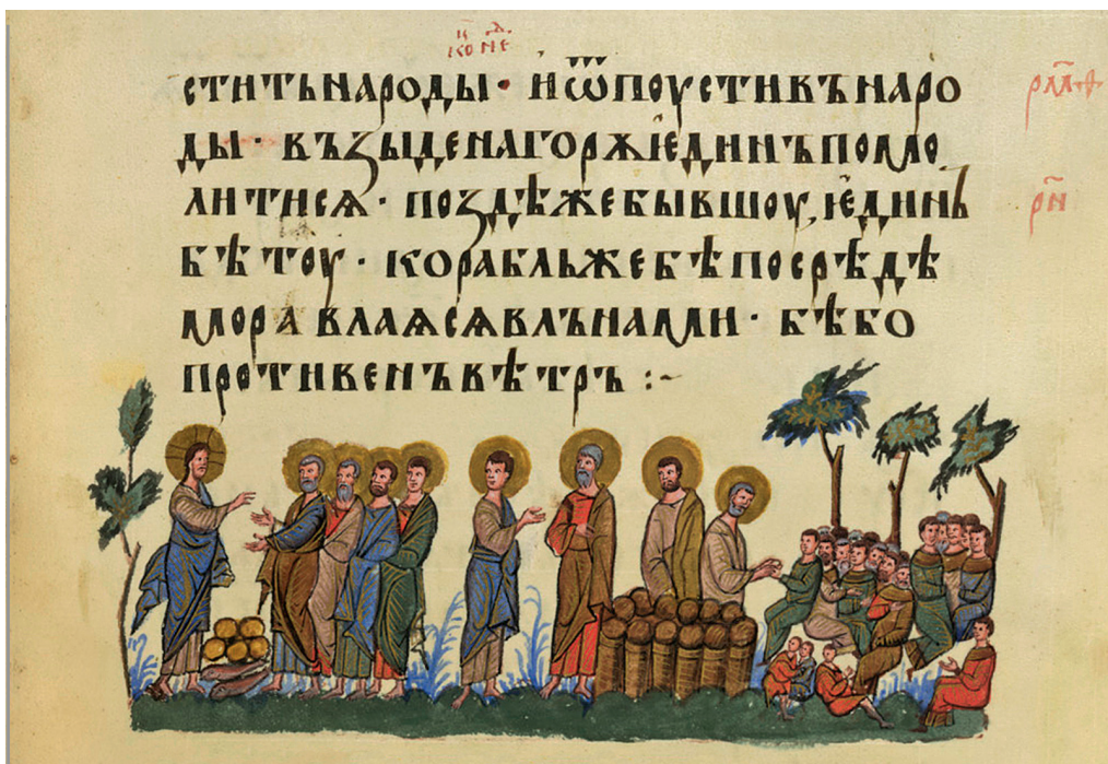
Насыщение народа пятью хлебами. Хожение по водам. Миниатюра из Четвероевангелия царя Иоанна Александра. 1356 г. (Британская библиотека, Лондон. Add MS 39627)

И, найдя Его на той стороне моря, сказали Ему: Равви! когда Ты сюда пришел? Иисус сказал им в ответ: истинно, истинно говорю вам: вы ищите Меня не потому, что видели чудеса, но потому, что ели хлеб и насытились. Старайтесь не о пище тленной, но о пище, пребывающей в жизнь вечную, которую даст вам Сын Человеческий, ибо на Нем положил печать Свою Отец, Бог. Итак сказали Ему: что нам делать, чтобы творить дела Божии? Иисус сказал им в ответ: вот