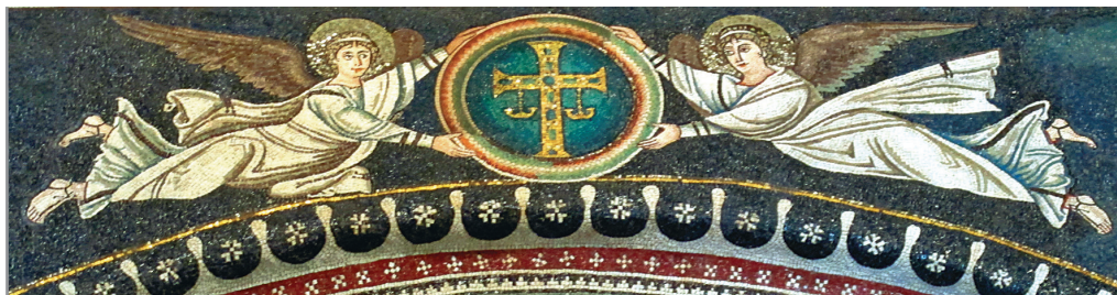
Орнамент с изображением «небесных хлебов». Ангелы, несущие хризмон. Мозаика базилики Сан-Витале в Равенне. 546–547 гг.

брат брата, и говорить: «познайте Господа», ибо все сами будут знать Меня, от малого до большого, говорит Господь, потому что Я прощу беззакония их и грехов их уже не вспомяну более (Иер. 31:31–34).