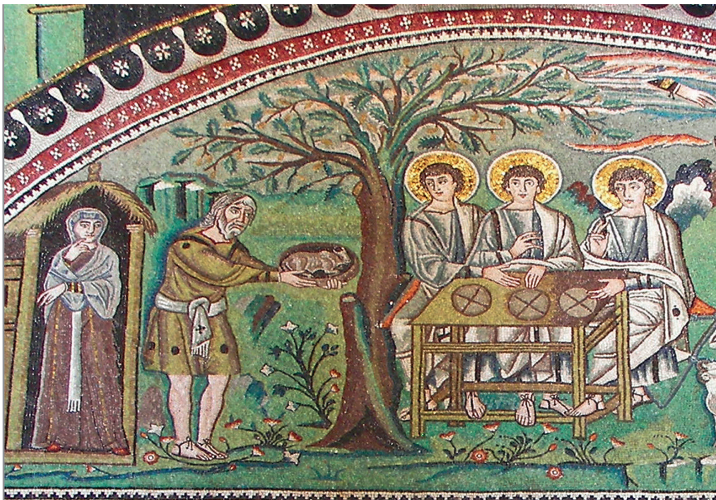
Гостеприимство Авраама. Мозаика базилики Сан-Витале в Равенне. 546–547 гг.

оскудение в земле Ханаанской и наличие в земле Египетской заставляют сыновей Иакова прийти к своему брату Иосифу. Выбор между хлебом и его отсутствием был выбором между жизнью и смертью: