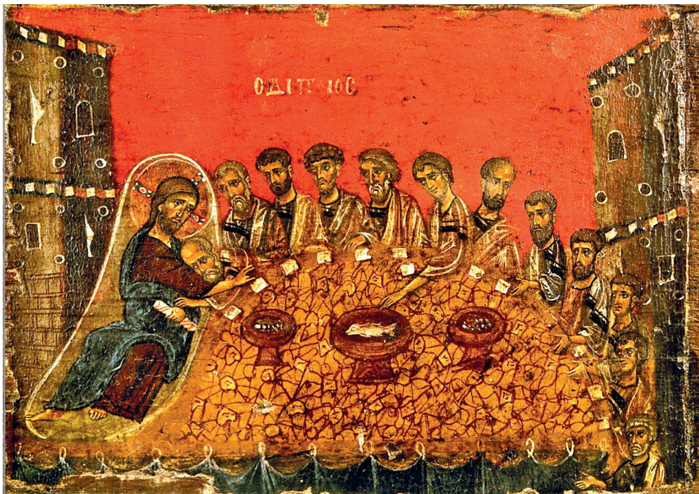
Тайная вечеря. Икона. Византия. XII в. Монастырь Ватопед на Афоне

хлеба» станет основой литургического бытия церковной общины (Деян. 2:42, 46). Для первых христиан этот опыт будет неразрывно сопряжен с опытом мученичества — предания собственной плоти на смерть и пролития собственной крови. Во II веке приговоренный к смерти Антиохийский епископ Игнатий, идя в Рим, где его ожидает казнь, напишет римским христианам: