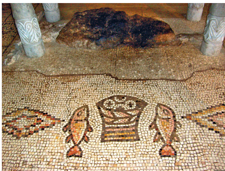
Хлеба и рыбы. Мозаика церкви Умножения хлебов и рыб в Табхе, Израиль. V в.

Беседа о небесном хлебе построена по тому же принципу, по которому строились многие беседы Иисуса с приходившими к Нему людьми. Иисусу было свойственно переключать внимание собеседника с предметов