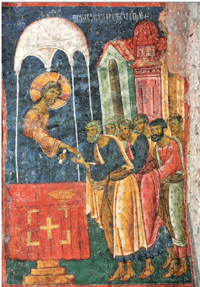
Причащение апостолов. Фреска в церкви св. Апосто- лов в Печской Патриархии. XIII в.

лия не говорит о каком-то идеальном мире. С первых страниц она повествует о мире, населенном людьми и животными — о мире, в котором для поддержания жизни каждому живому